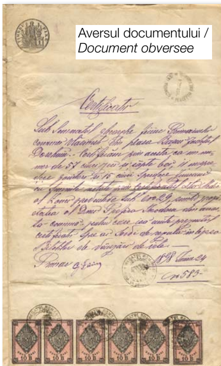
Aversul documentului / Document obverse