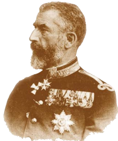
Carol I, Rege al României, Principe de Hohenzollern-Sigmaringen (n. 10 aprilie 1839, Sigmaringen - 10 octombrie, 1914, Sinaia) Carol I, King of Romania, Prince of Hohenzollern (born April 10 1839, Sigmaringen - died October 10, 1914, Sinaia)

Also, the Ministry is authorized to make the diligences for the supply of the necessary material for the application of this law.